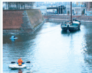
Stefan Böcklin, ein Tierschützer im Einsatz: eine schwimmende, überdachte Insel wird im Hafenbecken angebracht, um Küken ein Überleben zu ermöglichen

Ironischerweise stehen zwar an solchen "Betontümpeln", die an allen Seiten steile Mauern haben, (Hafenbecken, Lambertusgraben, Düsseldorf) Schilder: "Enten füttern verboten" - man nimmt also an, daß sich dort Enten aufhalten - nimmt aber billigend in Kauf, daß Entenmütter, die mit ihren Küken in dieses Gewässer springen, miterleben müssen, wie ihre Kinder fortdauernd tschilpen um dann innerhalb eines Tages vor Erschöpfung ertrinken. Hier wäre eine Hege städtischerseits nötig, in dem die erforderlichen Möglichkeiten geschaffen werden, daß Entenmütter mit ihren Jungen auch das Wasser verlassen können.