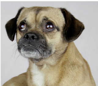
Dieser Mops kann atmen ...